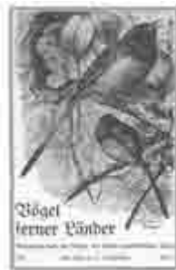
Zeitschrift "Vögel ferner Länder" Jahrgang 1928